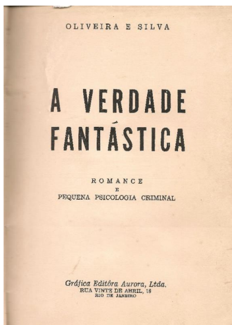
A verdade fantástica (1955)

ambas, sino que su naturaleza constituye una alternativa en el sentido de que la 'verdad ficcional' representa una opción que es posible elegir, además; o sea, no sólo entre 'no verdad' e 'inverossimilhança' pues la "verdade fantástica" puede compadecerse –como, en efecto, sucede al producirse la "absolvição do acusado" – con la "verdade verdadeira". Al mismo tiempo, la elección por la que la novela se decanta – una "versão maluca e complexa" – debería ser ponderada en un escenario de mayores dimensiones y profundidad; es decir, en toda la amplitud y hondura melodramática –y, en consecuencia, a menudo extremada – de 'la verdad' para con los ritos procesales en sí mismos considerados, responsables de su construcción.